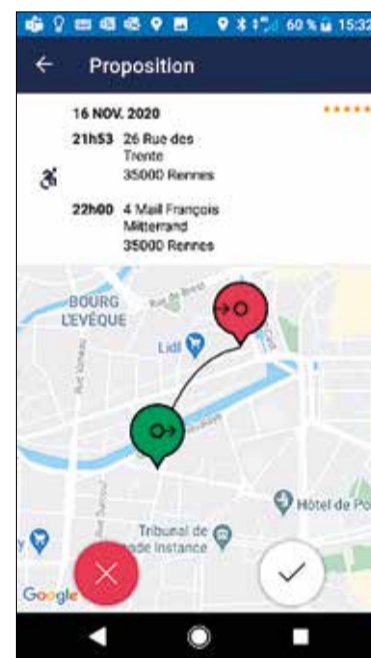
Récapitulatif du trajet

Pour l'utiliser, rien de plus simple : téléchargez HANDISTAR, l'appli sur votre smartphone puis créez votre compte. Vos identifiants vous seront adressés directement par mail.