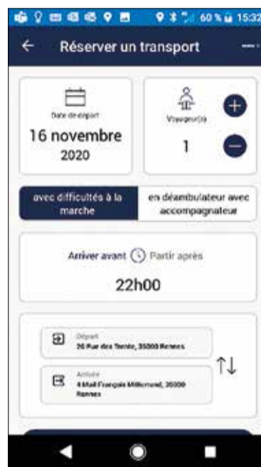
Réservation du trajet